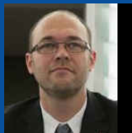
Davor Ivo Stier , MdPE (Croatie)

« Nous traversons une période de profonds changements qui font appel à un nouveau paradigme et une politique renouvelée de développement de l'UE. Le «Cadre de développement mondial pour l'après-2015» doit traiter les causes profondes de la pauvreté plutôt que d'en traiter les symptômes. Il doit être centré sur les personnes et fondé sur les droits, mettant la dignité humaine au cœur de tous nos efforts. Une bonne gouvernance mondiale et une justice pour tous à travers le renforcement des institutions efficaces, responsables et inclusives doit devenir la pierre angulaire du nouveau cadre mondial pour le développement. »