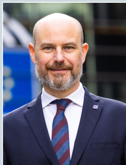
Vladimír Bilčík poslanec EP, Kordinátor skupiny PPE Výbory INGE a ING2

Vďaka práci všetkých našich kolegov, a dovoľm si s hrdosťou povedať, že najmä kolegov zo skupiny PPE, sa nám podarilo nielen presne opísať nástrahy zlomyselých zahraničných zásahov do našej demokracie, ale pomohli sme aj premeniť túto kedysi okrajovú tému na pevnú súčasť rokovaní o vonkajšej a vnútornej bezpečnostnej politike EÚ. Našou úlohou je teraz posilniť túto pozornosť verejnosti a navrhnúť odpovede a riešenia na neustále sa vyvíjajúce riziká zahraničných zásahov a dezinformácií. Vďaka tímu, ktorý sa nám podarilo vytvoriť v skupine PPE, nepochybujem, že sa nám to podarí.