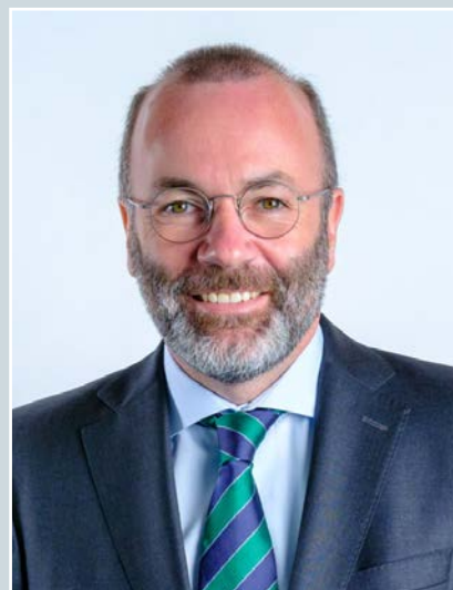
Manfred Weber poslanec EP, predseda skupiny PPE v Európskom parlamente

Chcel by som poďakovať členom skupiny PPE v osobitných výboroch, ktorí vykonali veľmi dôležitú prácu, aby zabezpečili, že naše priority skupiny PPE boli zahrnuté do správ, ako aj zamestnancom, ktorí sprevádzali prácu osobitných výborov.