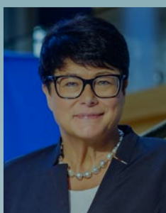
Sabine VERHEYEN Členka