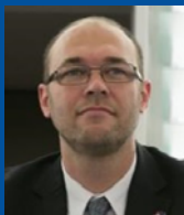
Davor Ivo Stier képviselő (Horvátország)

“Mélyreható változások korában élünk, amelyek paradigmaváltást igényelnek, és szükségessé teszik az uniós fejlesztéspolitika megújítását. A 2015 utáni uniós és globális fejlesztési keretnek a szegénység kiváltó okait kell kezelnie a tünetei helyett. Az emberekre kell összpontosítania és igazságosnak kell lennie, minden cselekvés középpontjába az emberi méltóságot helyezve. Az új globális fejlesztési keretnek a következő sarokkövekre kell épülnie: globális jó kormányzás és az igazságosság érvényesítése mindenki számára hatékony, elszámoltatható és befogadó intézmények révén.”