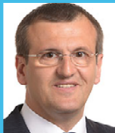
Cristian Dan Preda , poseł do Parlamentu Europejskiego (Rumunia) Członek Grupy EPL w Komisji Rozwoju PE

“Grupa EPL jest zaangażowana w zapewnianie jak największej skuteczności polityki rozwojowej UE przez wzmocnienie synergii między strategiami politycznymi i instytucjami w celu zwiększenia spójności naszej polityki na rzecz rozwoju”