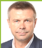
Bogdan Brunon Wenta , poseł do Parlamentu Europejskiego (Polska) Zastępca koordynatora z ramienia Grupy EPL w Komisji Rozwoju PE

“Pomoc nie wystarczy, aby zagwarantować zrównoważony rozwój. Bez dobrego sprawowania władzy na miejscu nie ma nadziei na poprawę warunków życia przeciętnego obywatela. Pomoc międzynarodowa powinna skupiać się na zachęcaniu państw, lokalnych rynków i społeczności do podejmowania działań na rzecz własnego rozwoju”