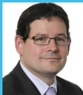
Ádám Kósa , poseł do Parlamentu Europejskiego (Węgry) Zastępca członka Komisji Rozwoju PE z ramienia Grupy EPL

“Europejski Rok na rzecz Rozwoju to wyjątkowa okazja, by wesprzeć prawa i potrzeby wszystkich ludzi, w tym najsłabszych i najbardziej zmarginalizowanych, a w szczególności prawa dzieci, młodzieży, kobiet i osób niepełnosprawnych”