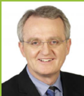
Rainer Wieland , diputado del PE (Alemania) Miembro de la comisión de Desarrollo del PE, perteneciente al Grupo PPE

“El desarrollo no solo es una cuestión de crecimiento económico. Un compromiso firme de todas las partes interesadas conducirá inevitablemente al éxito de nuestros esfuerzos como mayor donante de ayuda humanitaria en el mundo. Pocas veces en la Historia ha habido guerras entre democracias. Más aún, si comparamos los países más desarrollados y los menos desarrollados, estos últimos salen mejor parados cuando son democráticos”