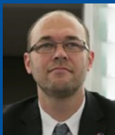
Davor Ivo Stier , deputato al Parlamento europeo (Croazia) Coordinatore del Gruppo PPE nella commissione per lo sviluppo del Parlamento europeo, relatore del Parlamento europeo per l’iniziativa sul quadro di sviluppo globale post 2015

“Stiamo affrontando un periodo di profondi cambiamenti che richiedono un nuovo paradigma e una rinnovata politica di sviluppo dell’UE. Il ‘quadro di sviluppo globale post 2015’ deve affrontare le cause profonde della povertà invece di curarne i sintomi. Occorre che esso sia incentrato sulle persone e fondato sui diritti, ponendo la dignità umana al centro di tutti i nostri sforzi. I pilastri fondanti del nuovo quadro di sviluppo globale dovranno essere la buona governance globale e la garanzia della giustizia per tutti attraverso la creazione di istituzioni efficaci, responsabili e inclusive”